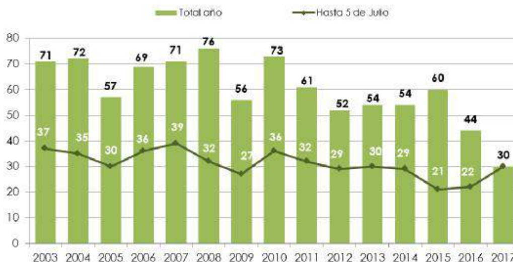
Víctimas mortales por Violencia de Género. De 1 de enero de 2003 hasta 5 de Julio de 2017