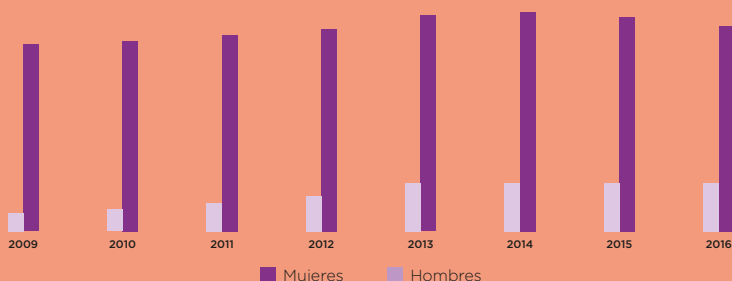
Porcentaje de los trabajadores a tiempo parcial en el empleo total según periodo. Mujeres y Varones en España, Sexo, Porcentaje respecto al empleo total de personas del mismo sexo.

Además de por cuidados de niñas y niños o de personas adultas enfermas, otros motivos por los que las mujeres solicitan reducción de jornada son los indicados en la siguiente tabla: